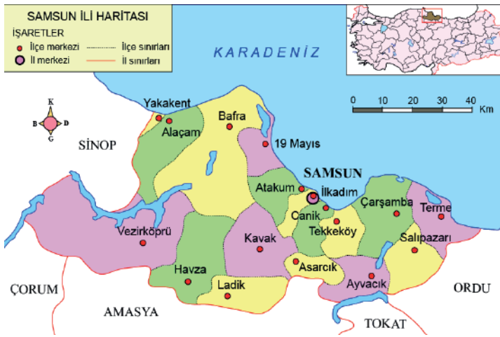
Görsel 30.1. Samsun İli Haritası

Türkiye’de Karadeniz Bölgesinde yer alan Samsun, 1.336 milyon nüfusa sahiptir. Coğrafi konum olarak bölgenin ortasında yer alması nedeniyle çok sayıda gerek özel gerekse kamu kuruluşlarının müdürlükleri bulunmaktadır. Samsun ili haritası Görsel 30.1.’de gösterilmektedir. Samsun sahip olduğu doğal güzellikleri ve tarihi değerleri ile turistik açıdan önemli potansiyele sahiptir. Turistik bir destinasyon olarak düşünüldüğünde ise havayolu, karayolu, demiryolu ve denizyolu ile ulaşım konusunda avantajlı konumda yer almaktadır. Anadolu’nun düşmanlardan savunulması konusunda verilen önemli kararların alındığı ve Atatürk’ün İstiklal Savaşı’nı başlattığı yer olması nedeni ile önemini daima korumaktadır (Samsun İl Kültür ve Turizm Müdürlüğü, 2020). Samsun ilinin haritası Görsel 30.1’de verilmiştir.