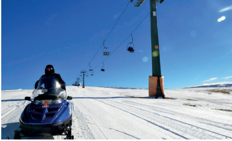
Görsel 30.3. Akdağ Kayak Merkezi

Samsun büyükşehir belediyesi Anakent Ticaret Turizm A.Ş. tarafından işletmesi yapılan kayak merkezindeki telesiyerjden elde edilen gelir miktarı aşağıdaki görselde verilmiştir (Görsel 30.4).