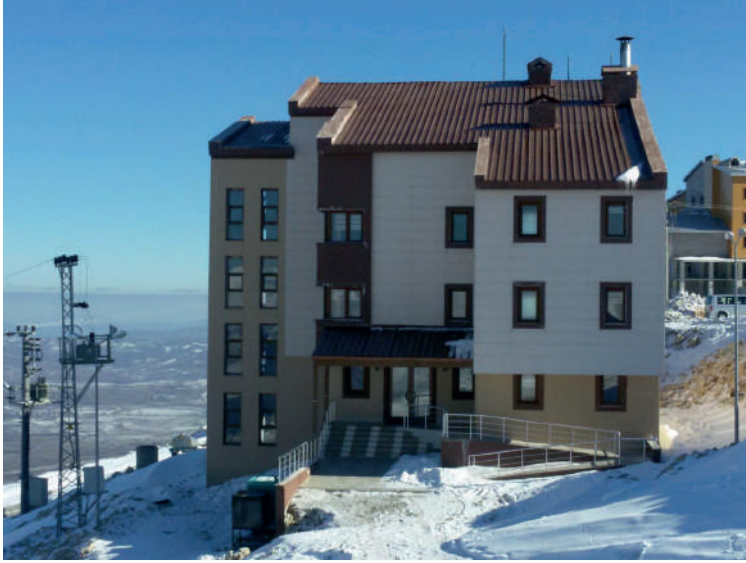
Görsel 30.8: OMÜ Kış Sporları Merkezi

Kayak merkezinde yapım aşamasında olan üçüncü tesis ise Gençlik ve Spor Bakanlığı tarafından yapılan tesistir. Bakanlık tarafında 2020-2021 sezonuna (2020 Aralık ayı) yetiştirilmesi planlanmaktadır. Tesiste 2 adet engelli odası, 3 adet süit oda ve toplam 40 oda olması planlanmaktadır. Yaklaşık 300 kişiye hizmet verebilecek nitelikte konferans salonu bulunmaktadır.