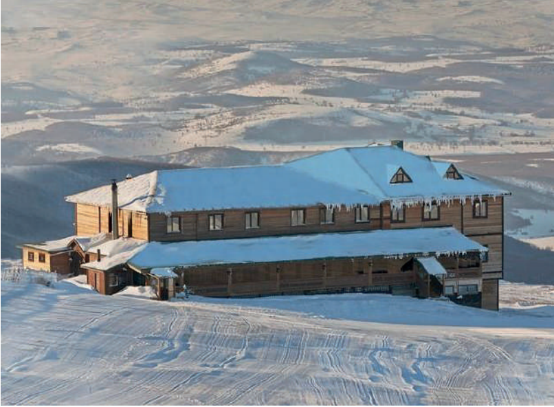
Görsel 30.7: Akdağ Gümüşpark Resort Otel

2016 yılında kayak merkezi sınırları içerisinde hizmet vermeye başlayan diğer tesis ise Ondokuz Mayıs Üniversitesi Ladik Akdağ Kış Sporları Merkezidir. İşletmede 2 adet süit oda 20 adet standart oda bulunmaktadır. İşletme sadece kayak sezonunda hizmet vermektedir. 2016 yılından beri genellikle Aralık ayında işletme açılmakta ve Nisan ayında ise kapatılmaktadır. Tesiste 30 kişilik restoran ve televizyon salonu bulunmaktadır. Tesisin misafirlerini genellikle kamu personeli oluşturmakla birlikte günübirlikçi ziyaretçiler de restoran hizmetlerinden yararlanmaktadır (Görsel 30.8).